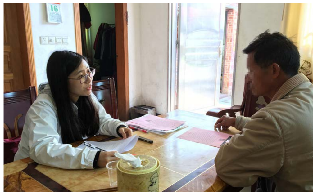
督导组进行入户回访