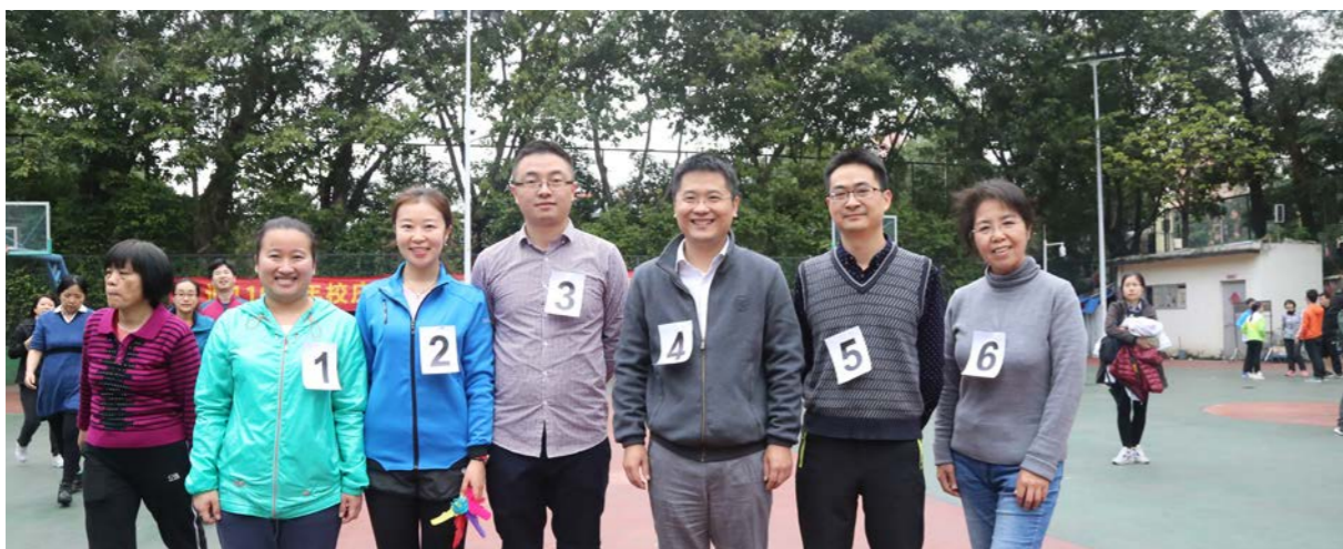
▲ 校运会上研究院毽球代表队