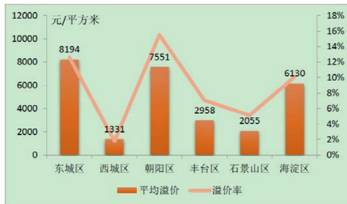
图1 2016年北京市内城六区重点小学学区房溢价