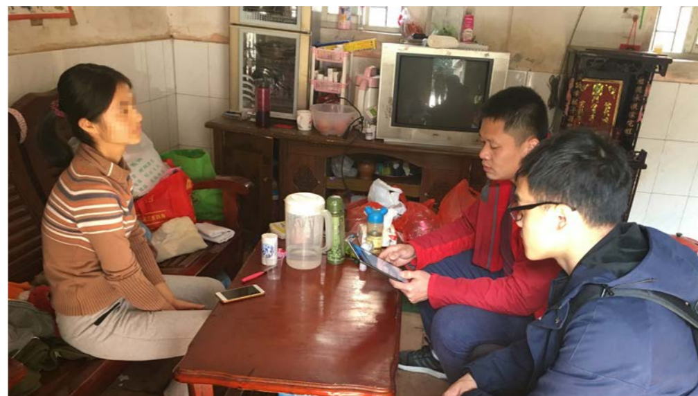
督导组进行入户跟访