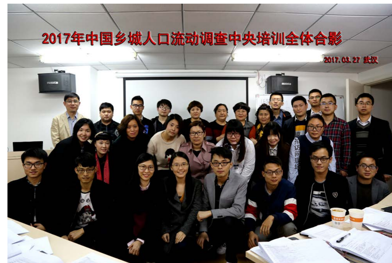
2017 年的 RUMiC 调查将于 4 月份正式在 15 个城市全面铺开，后续报道请持续关注 IESR。